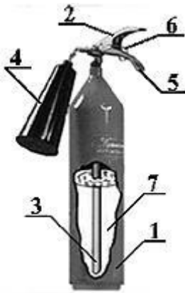
Рисунок 1. Устройство переносного огнетушителя ОУ.

При открывании запорно–пускового устройства (нажатии на рычаг 2 ), заряд углекислоты по сифонной трубке 3 поступает к раструбу 4 . При этом происходит переход двуокиси углерода из сжиженного состояния в твердое (снегообразное), сопровождающийся резким понижением температуры до минус 70^{\circ}\text{C} .